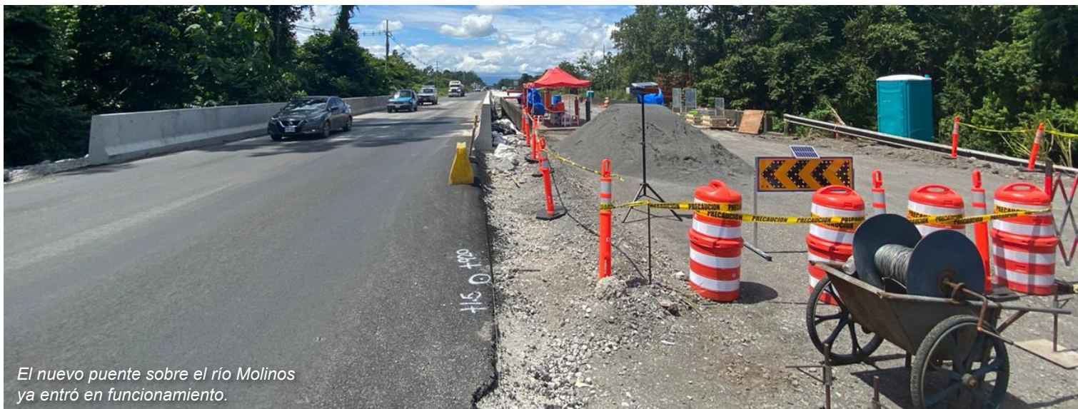
El nuevo puente sobre el río Molinos ya entró en funcionamiento.