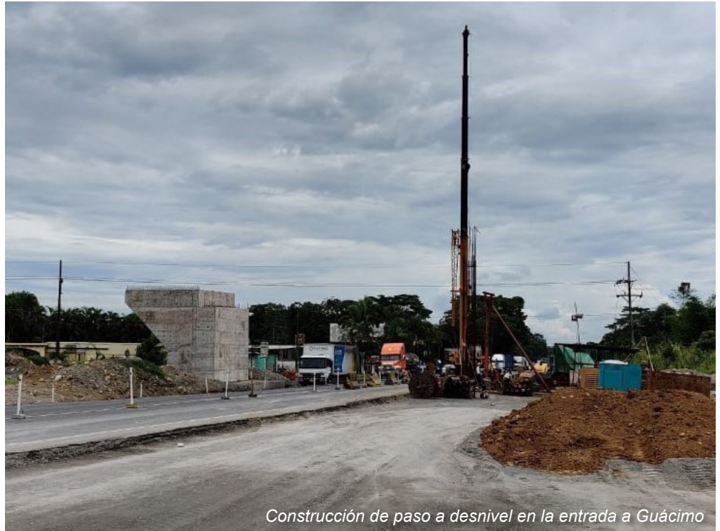
Construcción de paso a desnivel en la entrada a Guácimo

Cabe resaltar que para la rehabilitación de la vía y su ampliación a cuatro carriles la necesidad de realizar expropiaciones es mínima, pues las obras se ejecutan dentro de los 50 metros de derecho de vía que actualmente son propiedad del estado y únicamente se requieren expropiaciones en lugares en que la carretera tiene niveles muy distintos al entorno del proyecto, esto a fin de garantizar la estabilidad de los taludes laterales. El 95% de estos predios a expropiar corresponden a los terrenos en donde se realizará la construcción de los 13 pasos a desnivel y 5 intercambios principales que existirán a lo largo de la ruta.