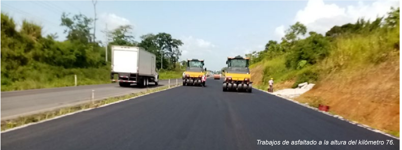
Trabajos de asfaltado a la altura del kilómetro 76.