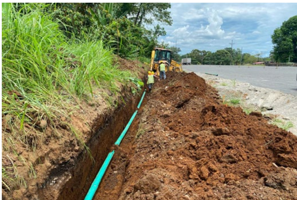
Trabajos de reubicación de servicios.

Se continuarán las gestiones para lograr más acuerdos de "entrada en posesión voluntaria" (permisos de los propietarios actuales) de los terrenos necesarios para las obras, adicionales a los que ya se han obtenido.