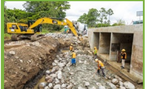
Más del 64% de los trabajadores en la ruta 32 son costarricenses