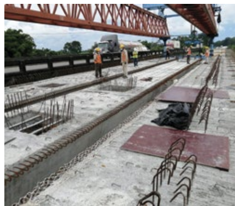
La ampliación del puente sobre el Río Chirripó muestra un avance del 84%.

Actualmente, la empresa CHEC cuenta con un 90% de la extensión del cuerpo principal del proyecto (de 107 kilómetros), en el cual pueden trabajar e ir avanzando sin ningún inconveniente.