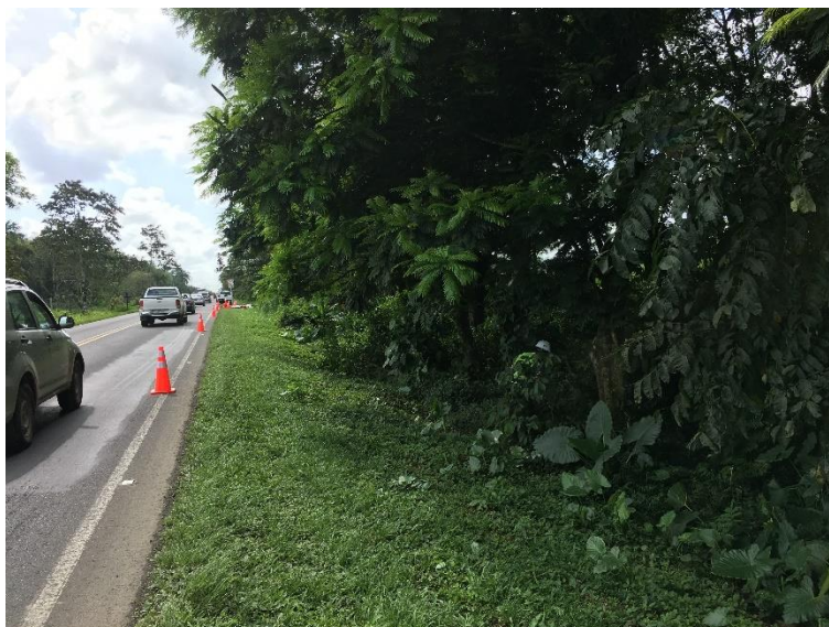
Fotografías del inicio del proceso de corta de árboles

En la siguiente tabla se presenta la cronología de los eventos para esta actividad.